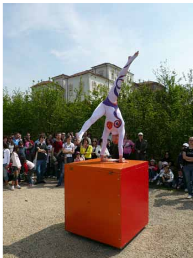
L'éPATE en L'AiR Cie Petites Histoires de Cubes