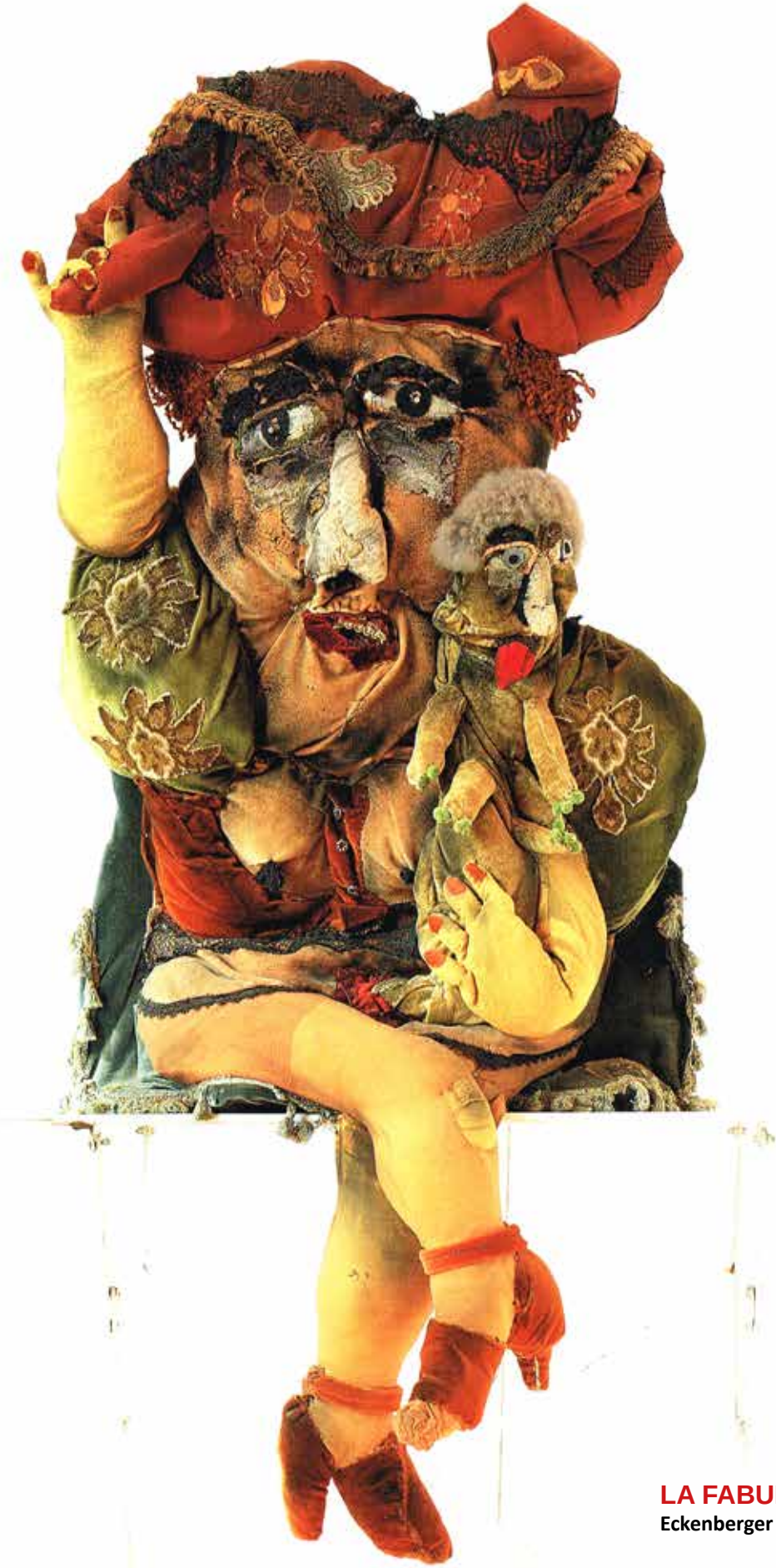
LA FABULOSERIE Eckenberger - Mère possessives