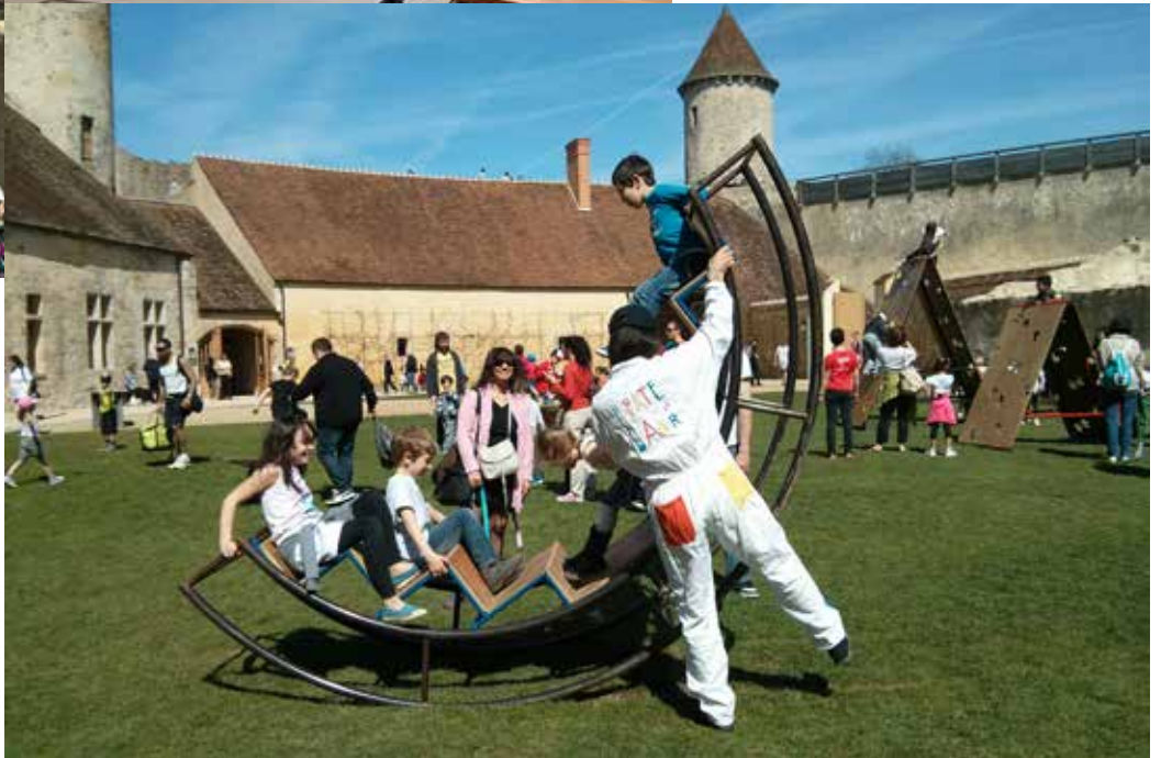
L'épate en L'Air Cie - Jeux en L'Air